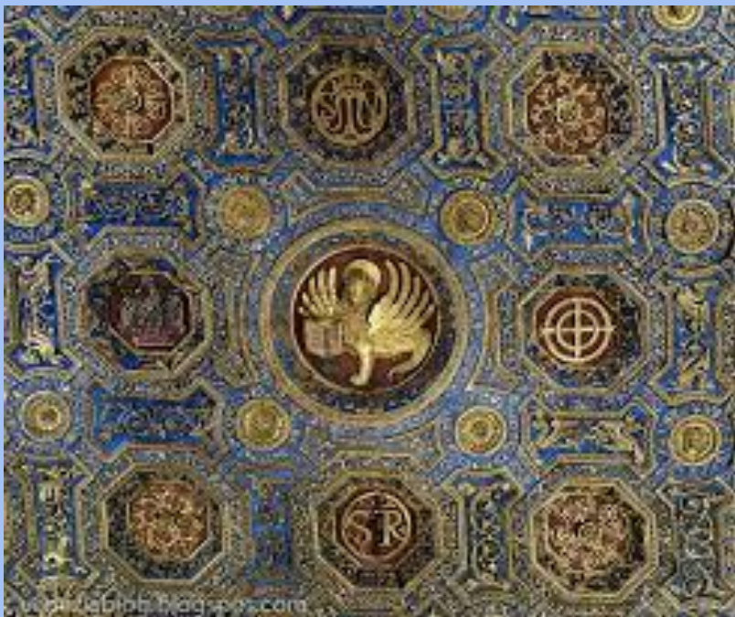
Le decorazioni sul soffitto.